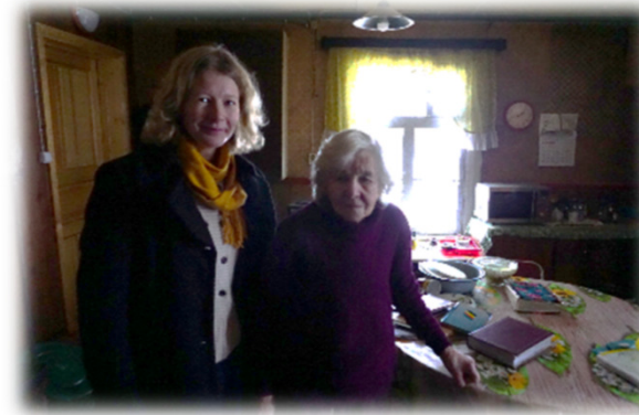
Välitööd Tudu külas.