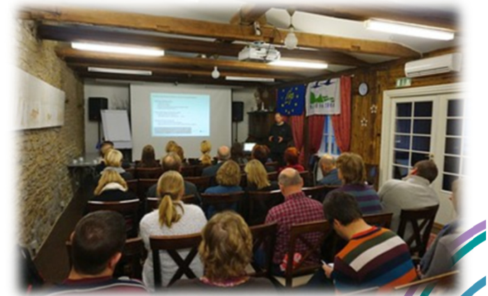
Tutvustamiskoosolek Rakveres, 2016.

*Jere Brophy „Kuidas õpilasi motiveerida? Käsiraamat õpetajatele“, Routledge