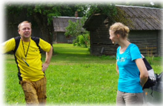
Välitööd Ohepalus.