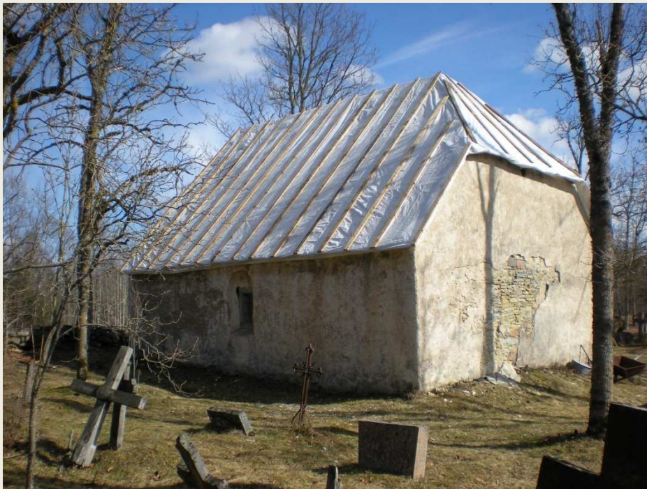
Vilivalla kalmistu kabel