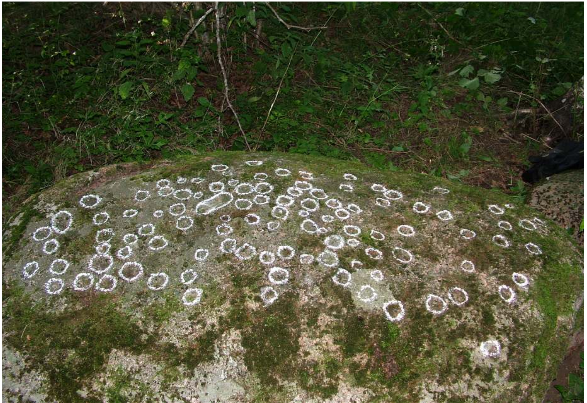
Lohukivi Mūrniekis Kurzemes