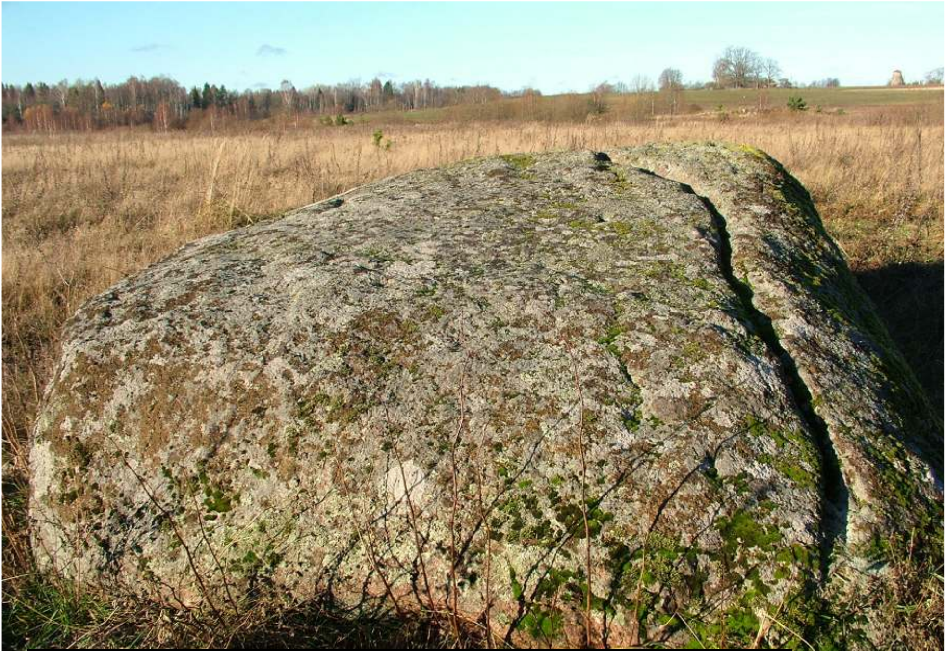
Lohukivi Kakis Vidzemes