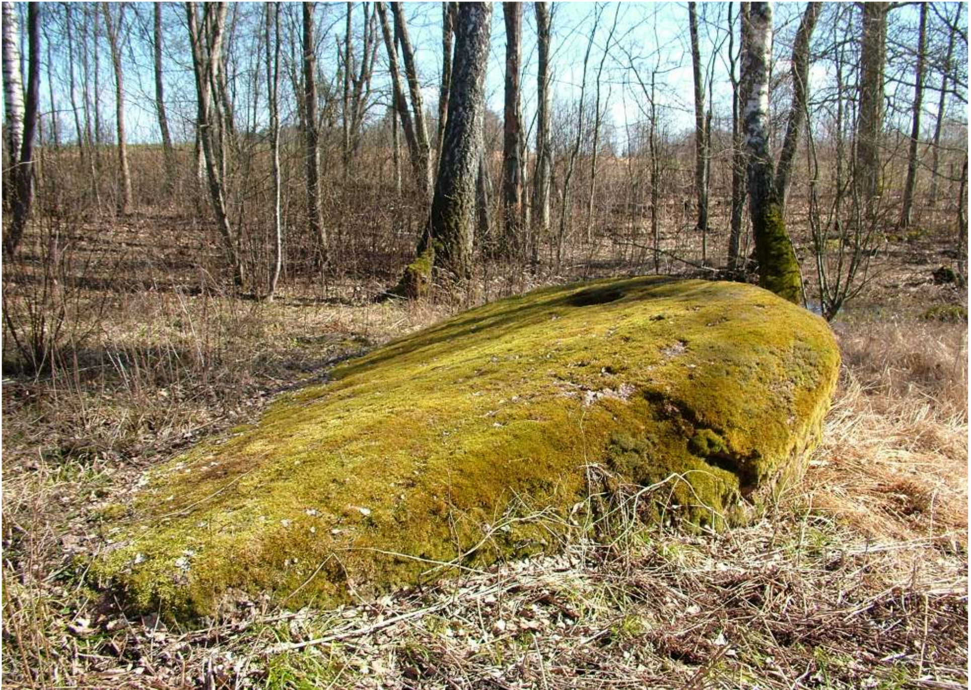
Väikseim lohukivi Lätis asub Vidzemes (Līvi küla Valmiera lähistel)