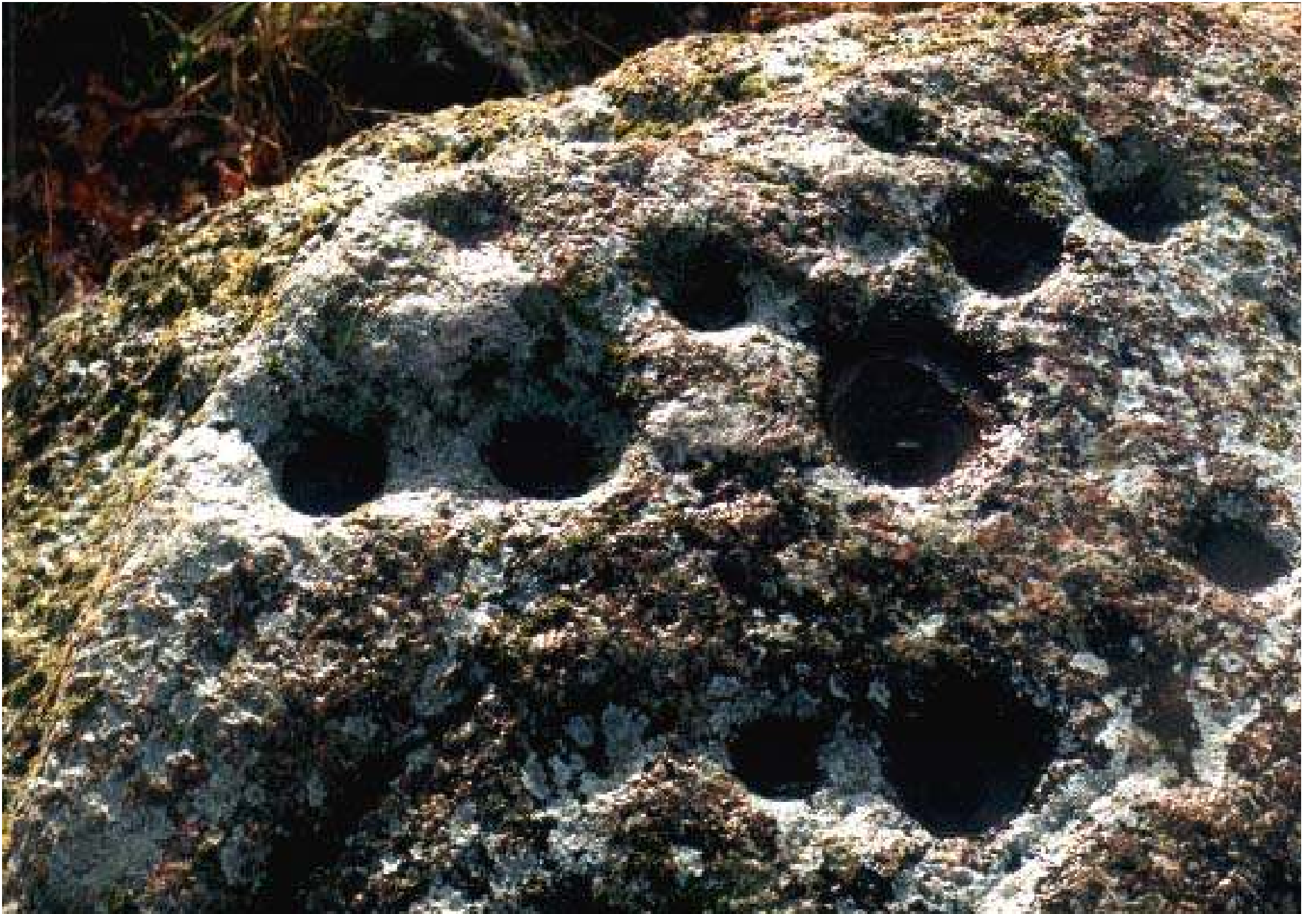
Lohukivi in Daviņis