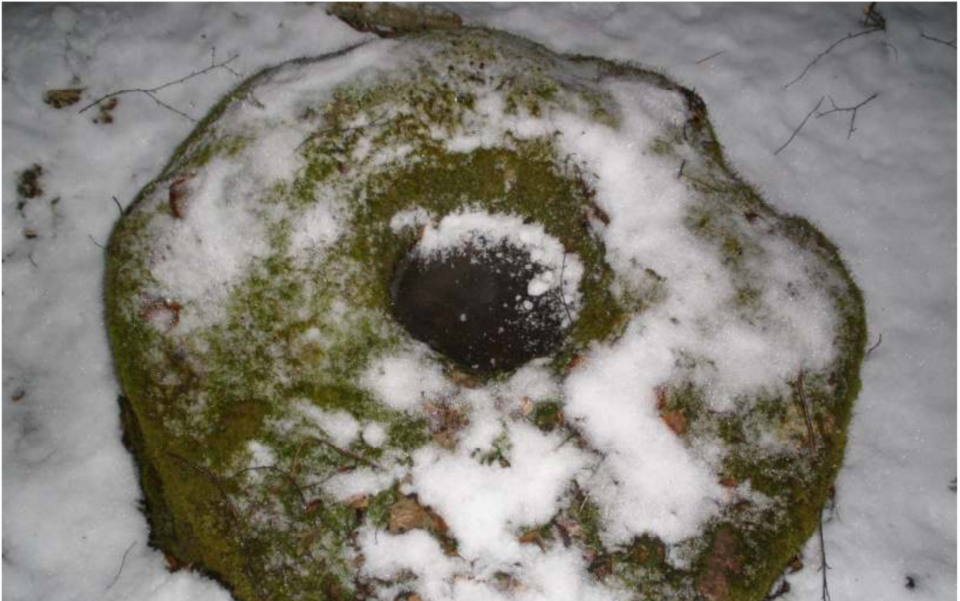
Cylindrical stones with hollow as bowl. In Latvian: “Bļodakmens”. Diameter of this kind of stones is about 1 m, diameter of hollow 35 – 60 cm, depth generally 10 - 15 cm. In Latvia like this are 20 stones.