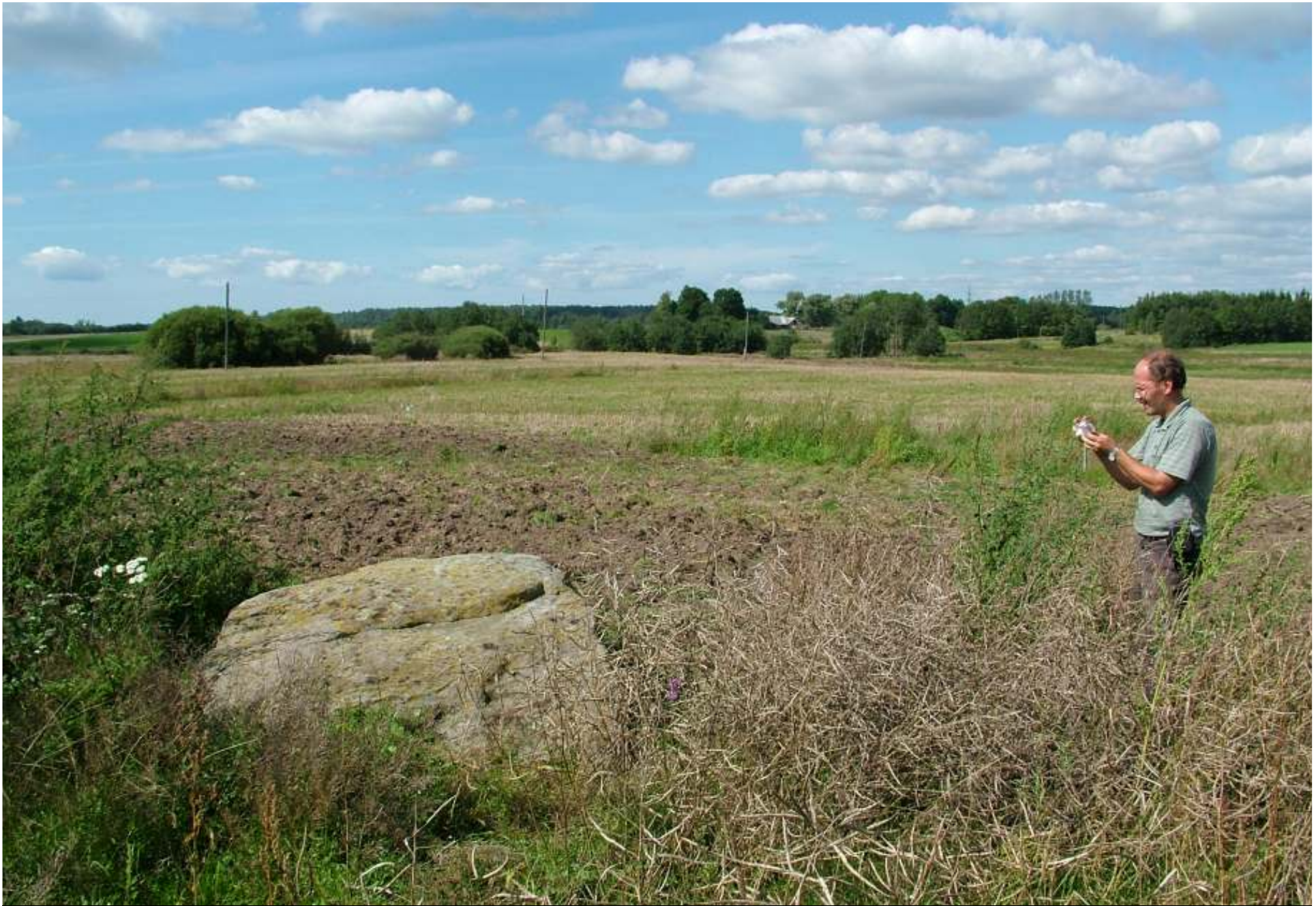
Lohukivi in Elekšis