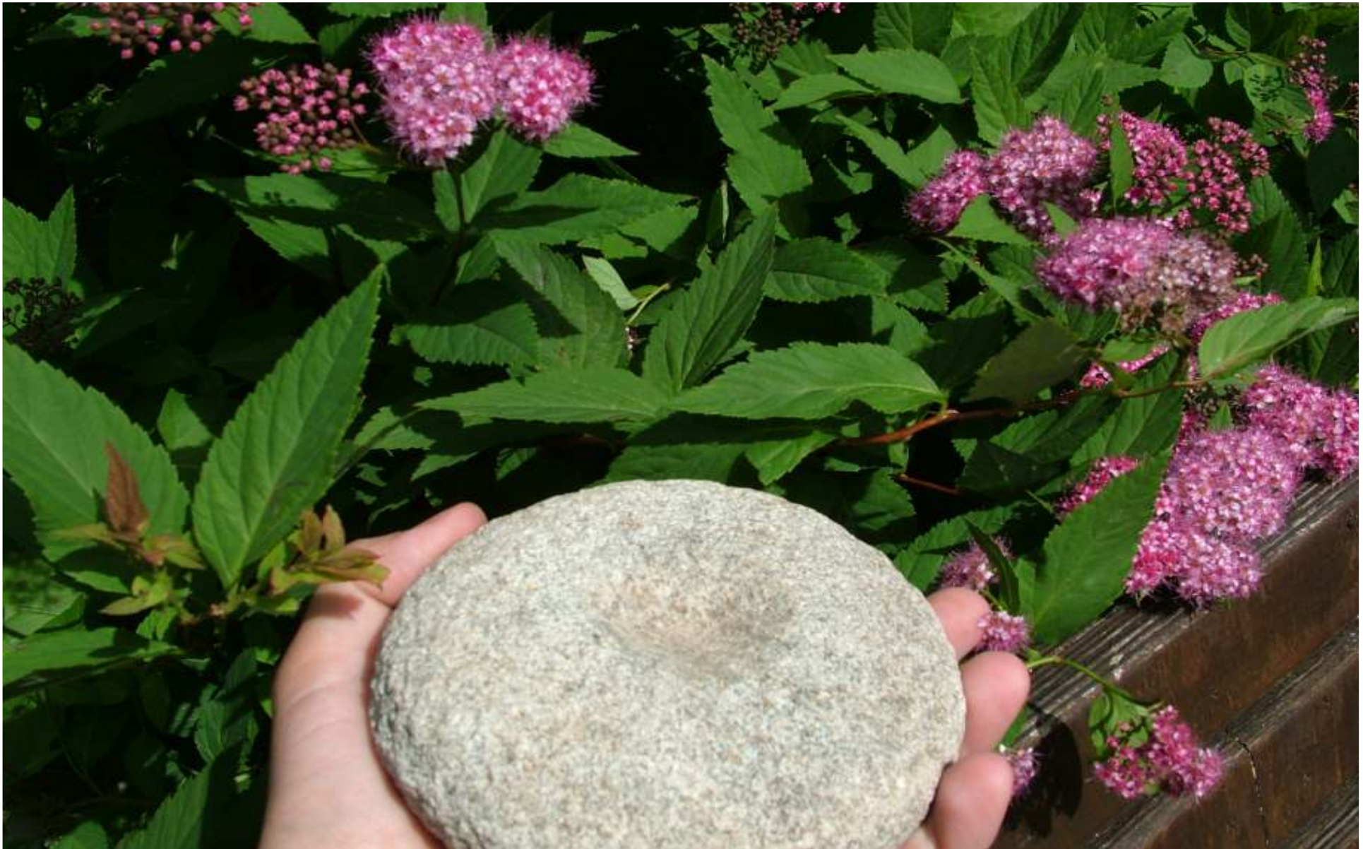
Taldrikukujulise süvendiga kivi. Süvendi sügavus ainult 2 cm, diameeter 20-30 cm. Lätis leitud ainult 3 sarnast kivi.