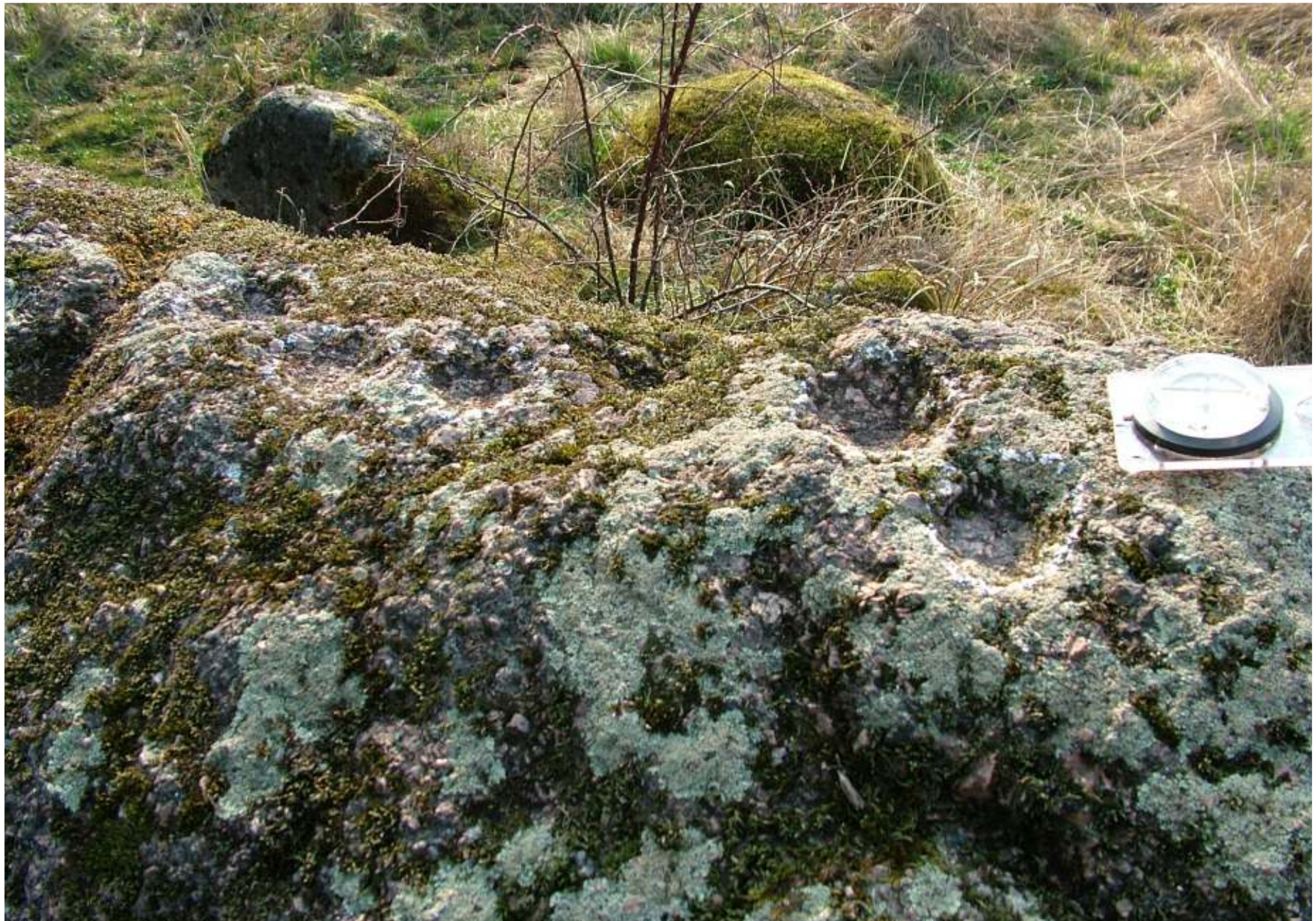
Lohukivi “Kapsēdes Rudais akmens” Kurzemes Liepāja lāhistel