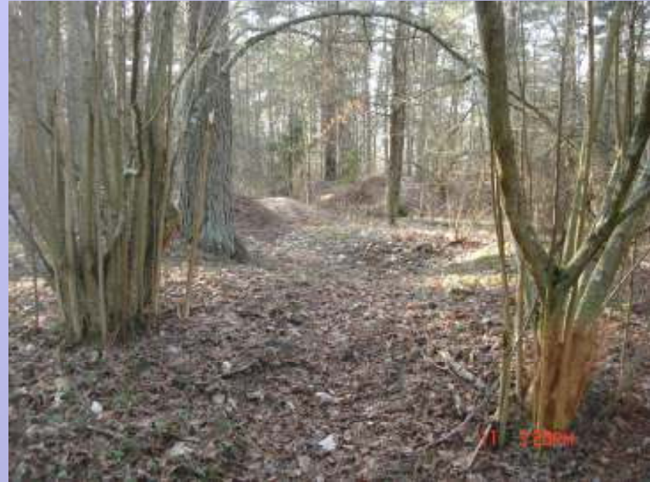
Sabiles Krievu kapi

Siniroheline sära murdub, Roosa päike tõuseb Või mu vennad sünnivad Vene (Poola, Saksa, Riia) kindluses