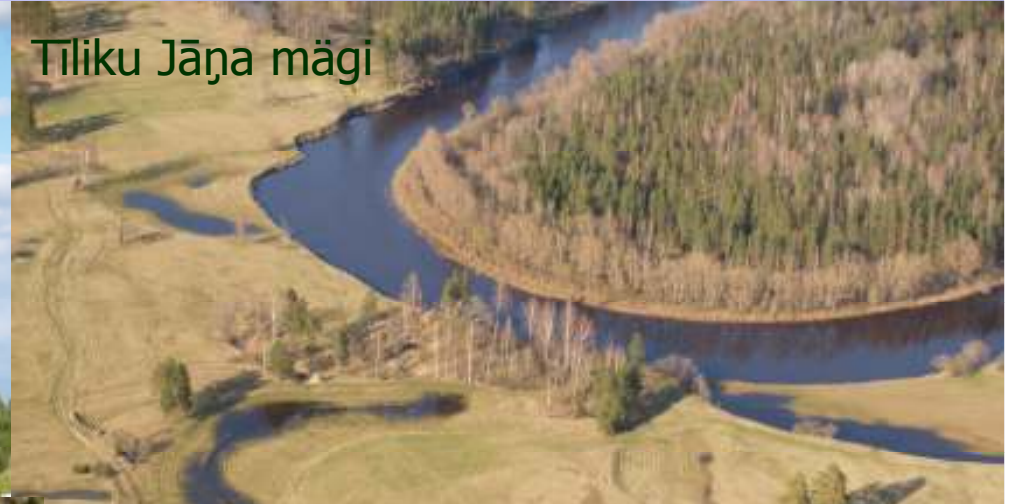
Tiliku Jāņa mägi