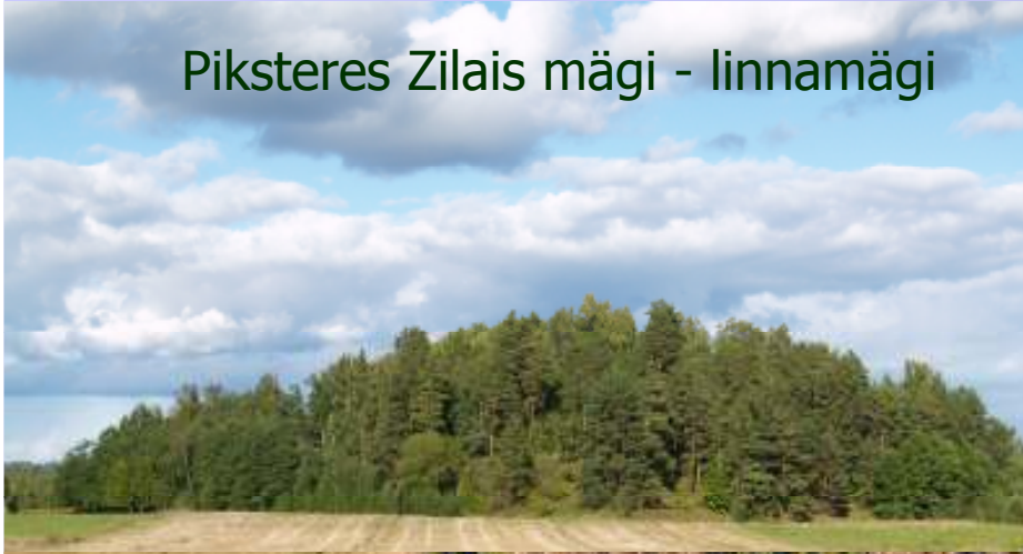
Piksteres Zilais mägi - linnamägi