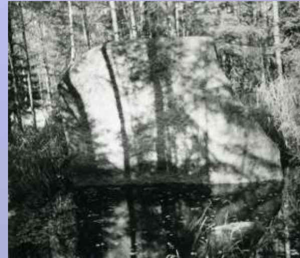
Basu Libahundi kivi