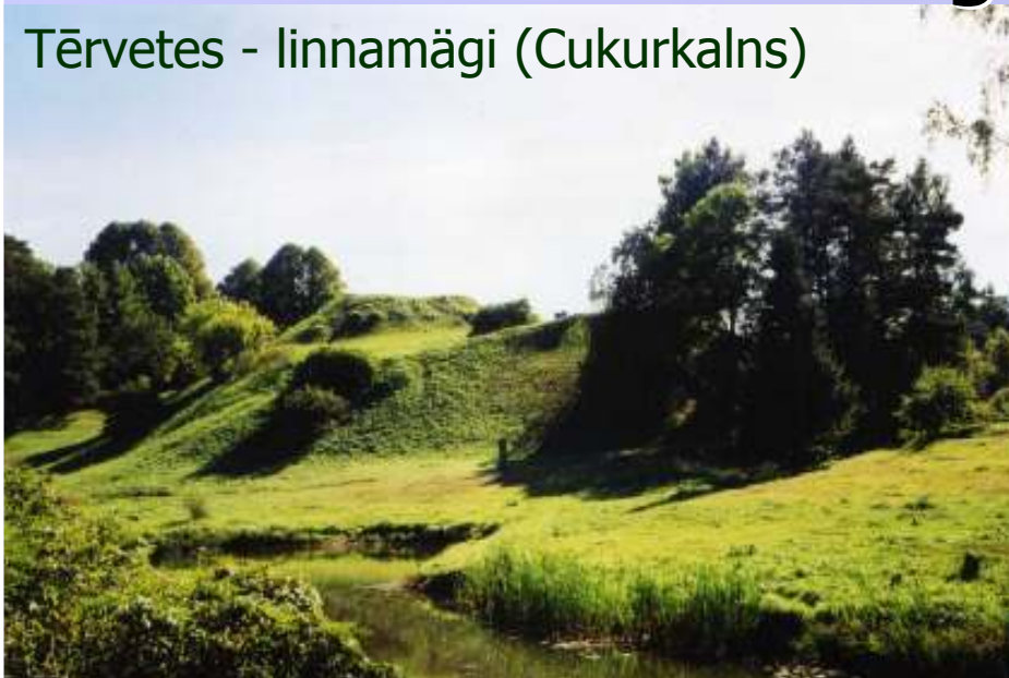
Tērvetes - linnamägi (Cukurkalns)