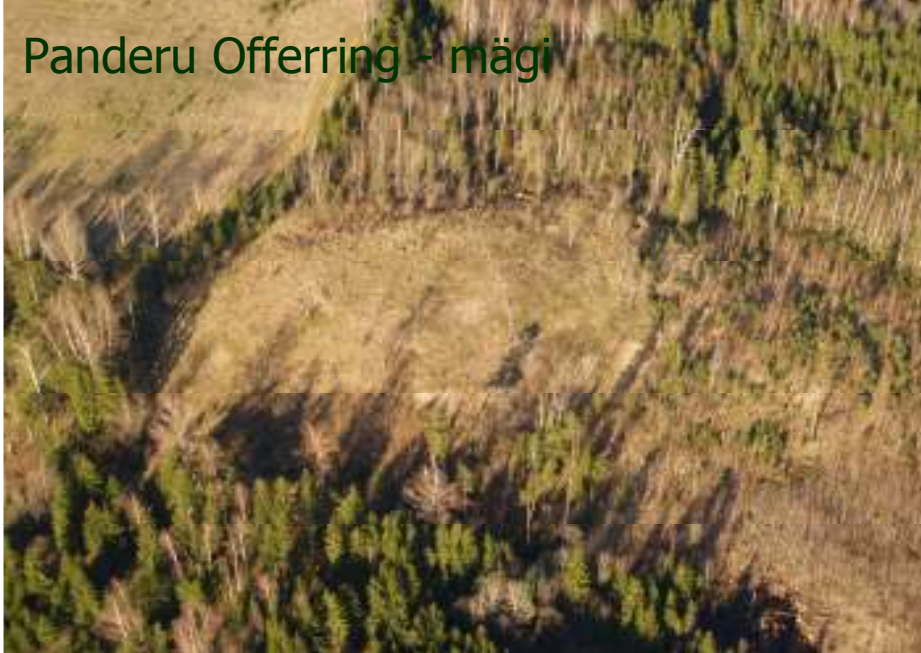
Panderu Offerring - mägi