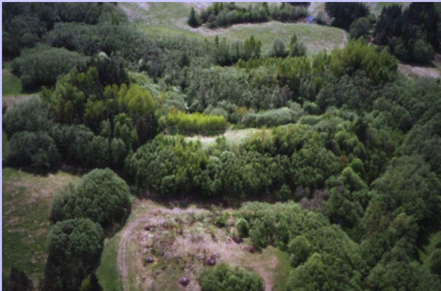
Arāju linnamägi (Zamok)