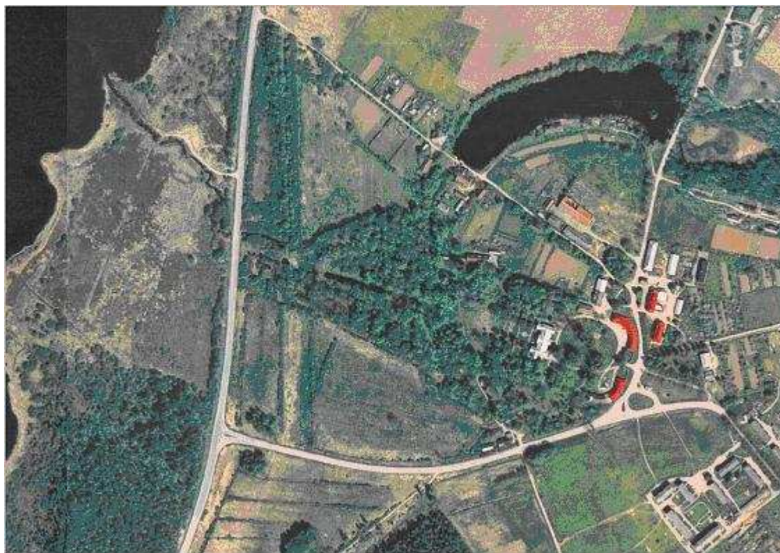
Õisu mõisa ümbrus aerofotolt