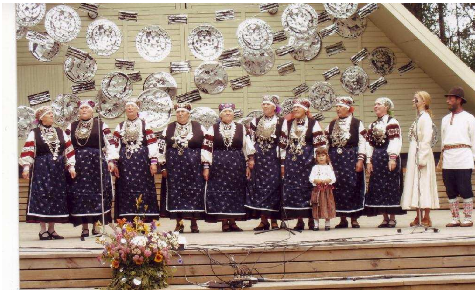
Mikitamäe leelokoor "Helmine"