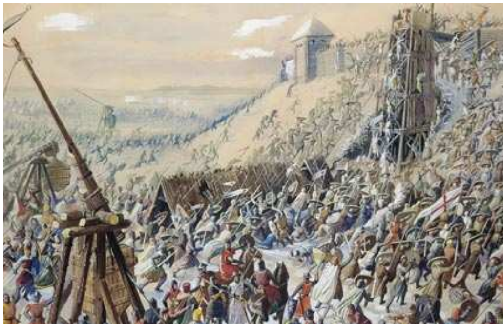
Muhu maalinna piiramine 1227 (Märt Bormeister)