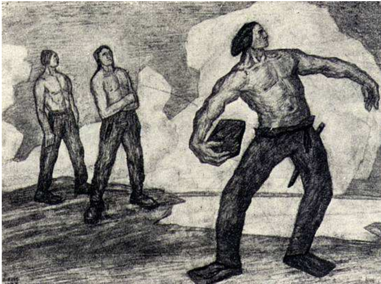
Kalevipoeg kivi viskamas (Kristjan Raud)